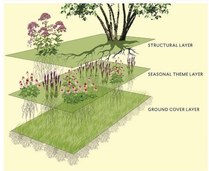
Photo: Planting in a Post-Wild World by Claudia West and Thomas Rainer