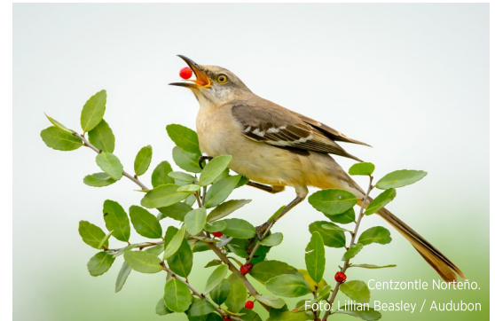
Centzonillo Norteño.

use estacas a prueba de agua para que sepa qué es lo que crecerá en primavera